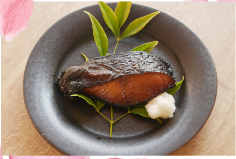
黒むつの照り焼き