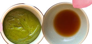
西尾抹茶 マヨソース ポン酢