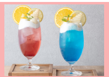
前島クリームソーダ